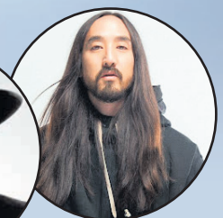
10. Steve Aoki [- 1]