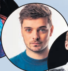
2. Martin Garrix [+ 1]