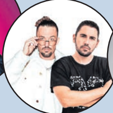
5. Dimitri Vegas & Like Mike [- 3]