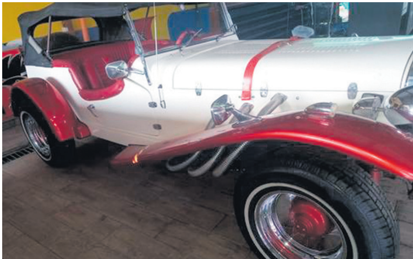
Chejazo fue condenado por la participación del asesinato de tres diputados salvadoreños del Parlacen.