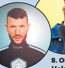
8. Oliver Heldens