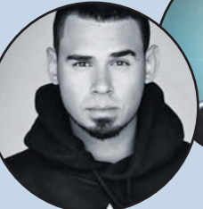
6. Afrojack [+1]