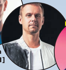
3. Armin van Buuren [+ 1]