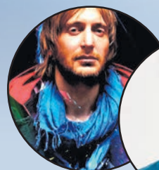
1. David Guetta

Mientras que en la segunda posición aparece Martin Garrix y en la tercera Armin van Buuren.