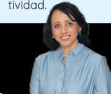
Por: Marlene Martínez P. Gerente de Comunicación de AGEXPORT.

La buena noticia es que Guatemala es una selección con talento y potencial, que necesita revisar su estrategia, ajustar su estructura y jugar en equipo público privado hacia el mismo objetivo. Porque aunque el país mejore, si otros países avanzan más rápido, pierde automáticamente competitividad.