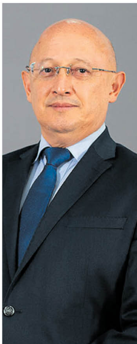
Hugo Maúl CIEN

Guatemala figura en esa posición gracias a un desempeño extraordinario en pilares que dependen de la disciplina técnica: en Salud Fiscal (95.9/100) tiene uno de los mejores puntajes del mundo. Lo que significa que el país